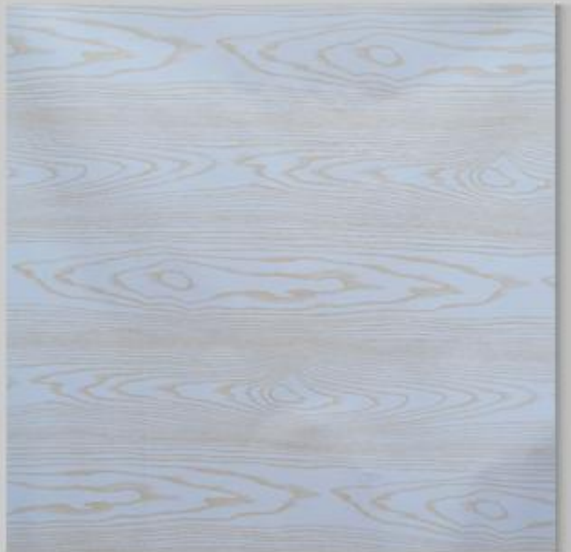
Code : 173