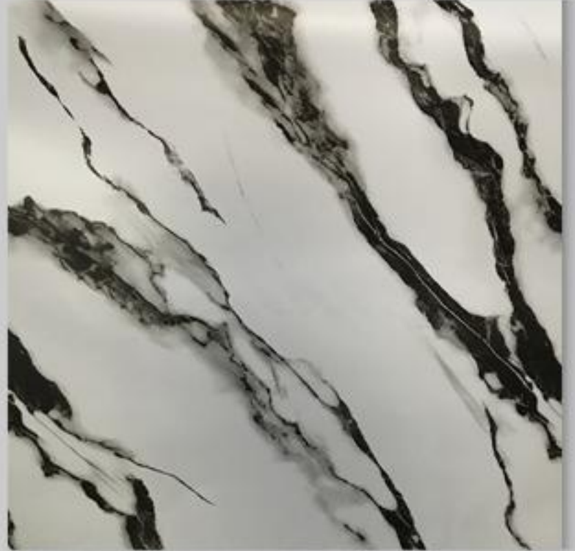
Code : 104