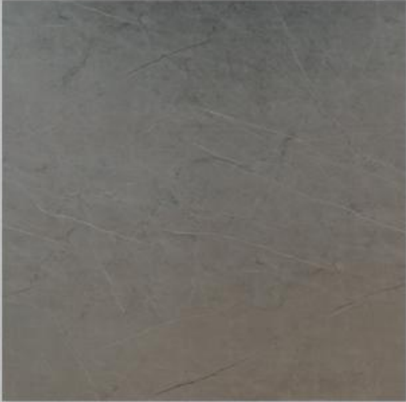
Code : 185