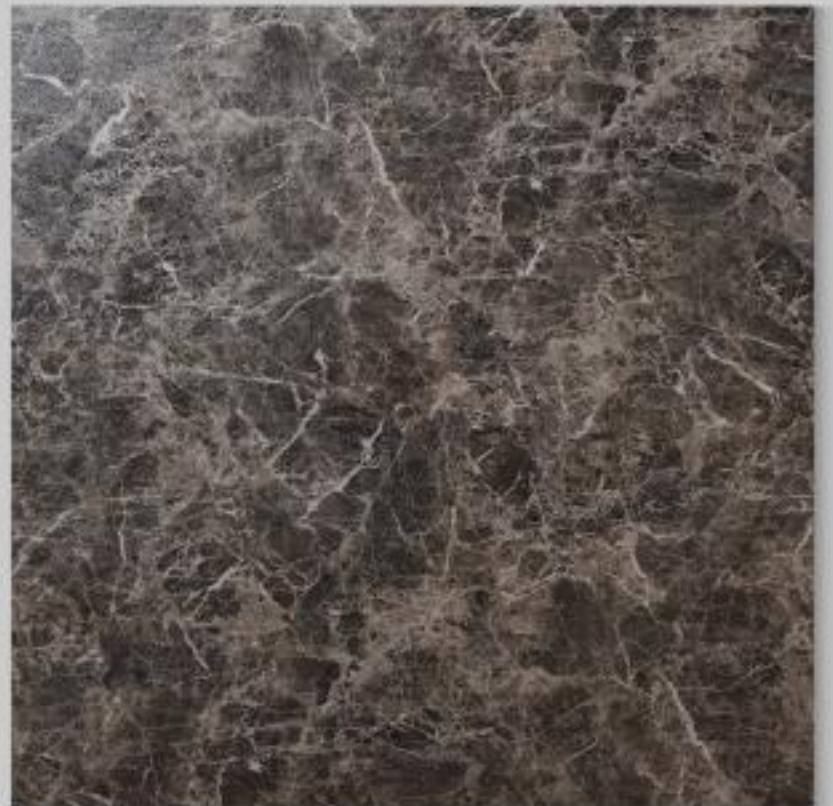
Code : 157