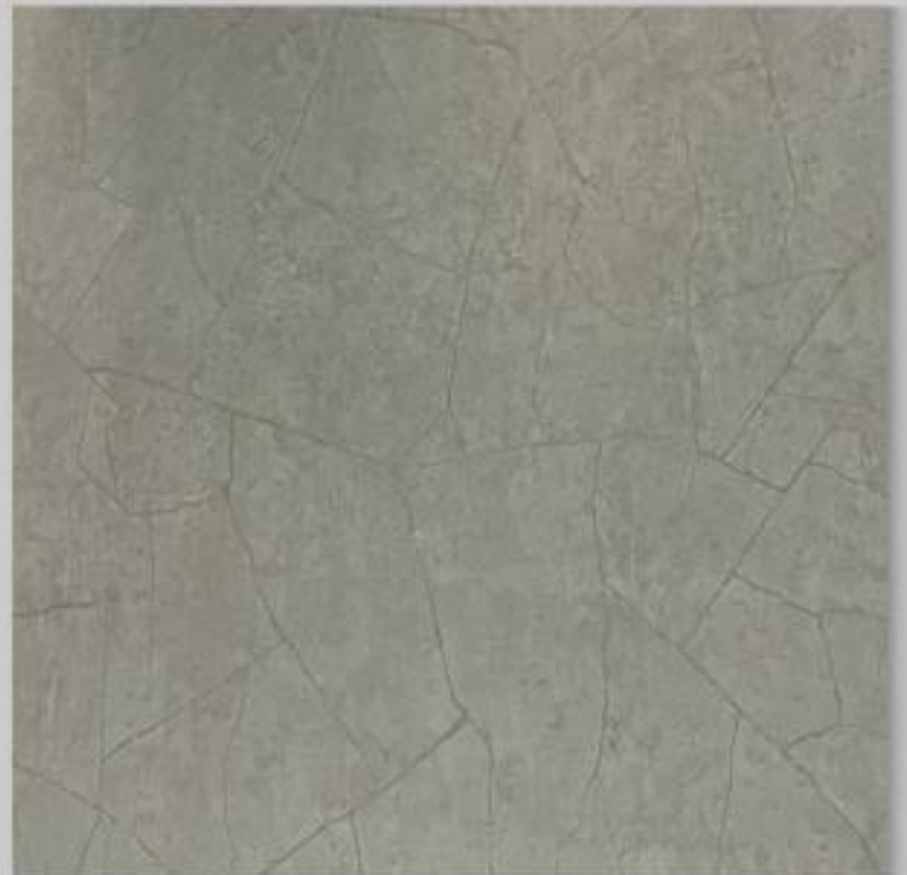
Code : 123