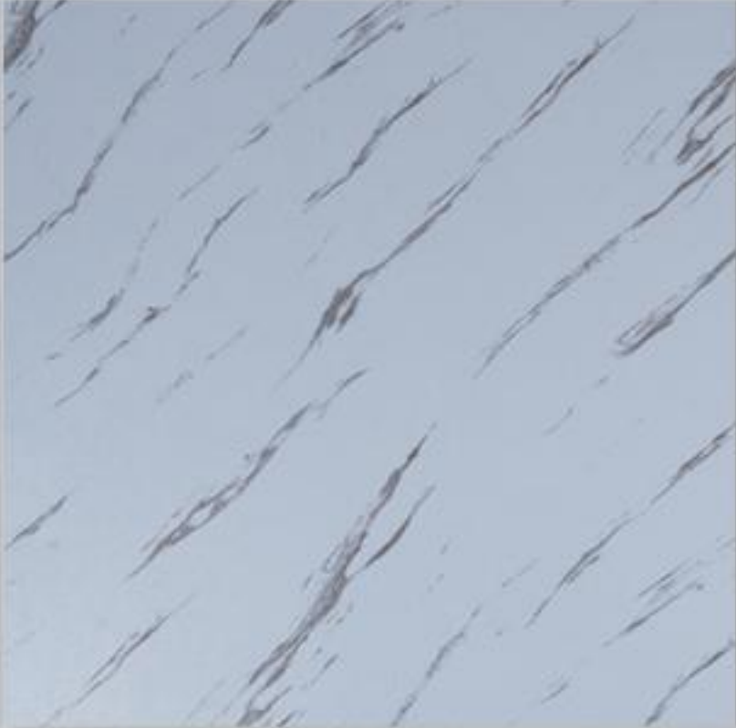
Code : 154