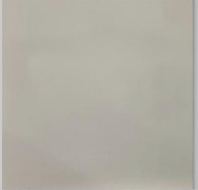
Code : 127