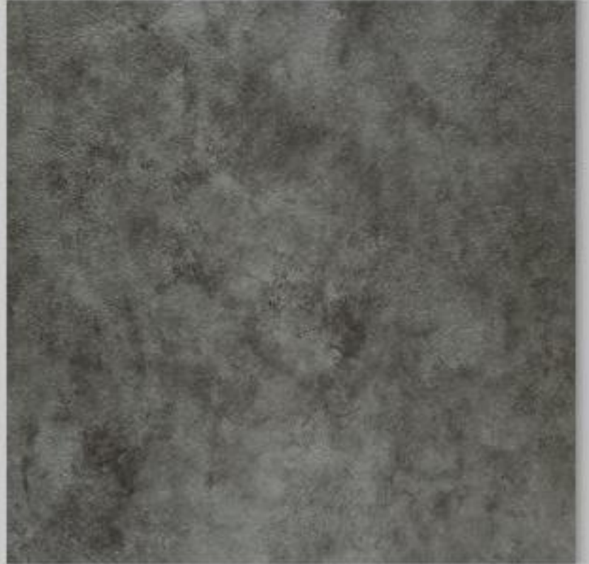
Code : 146