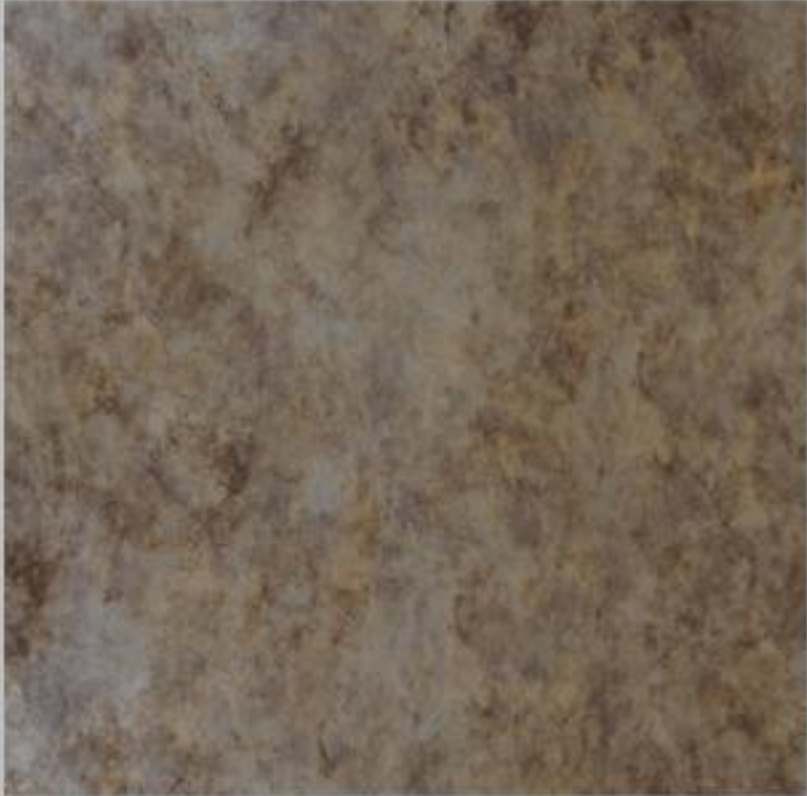
Code : 141