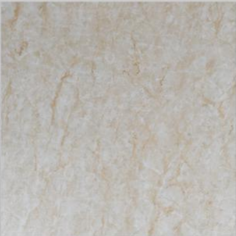
Code : 156