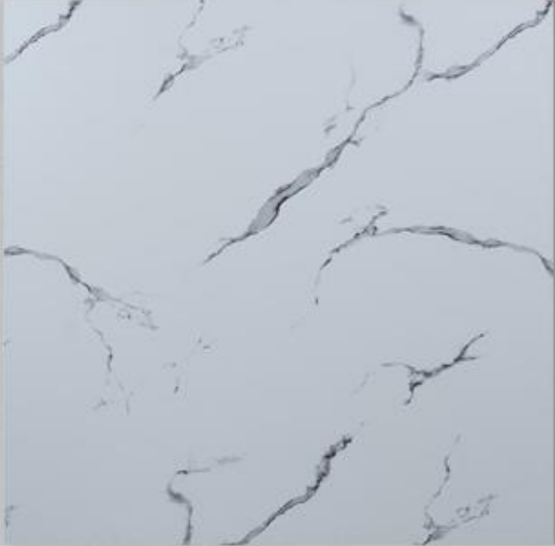
Code : 103