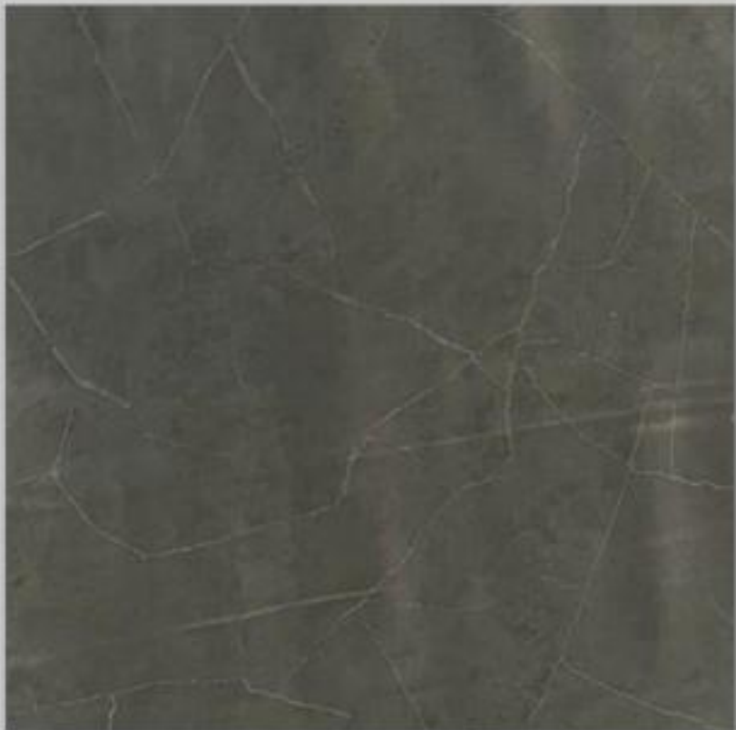
Code : 122