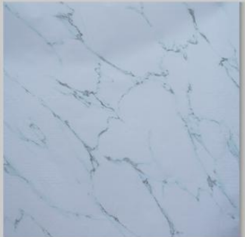
Code : 174