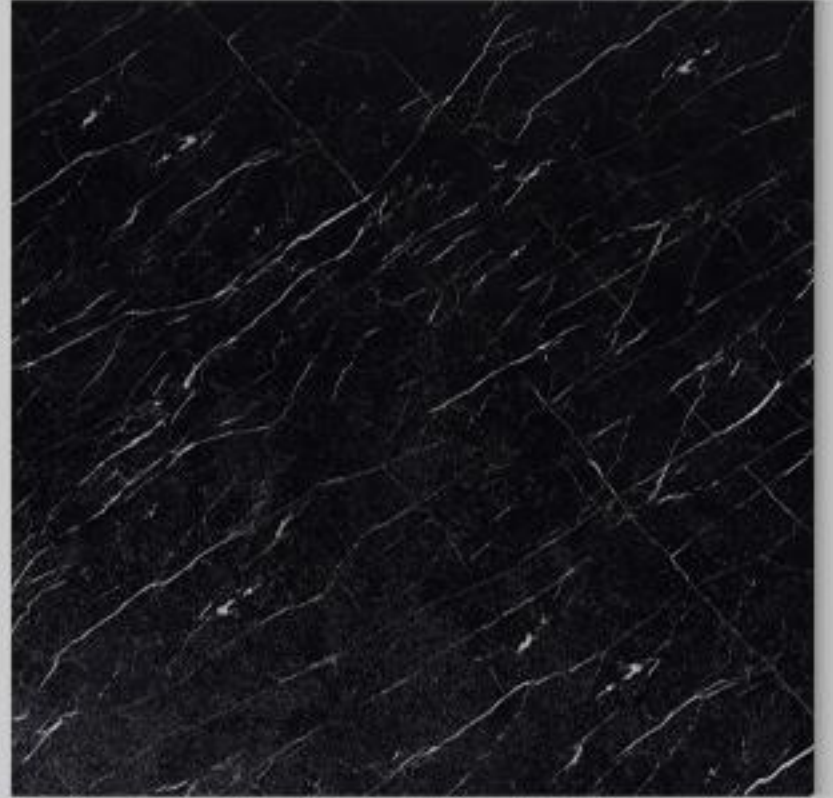
Code : 155