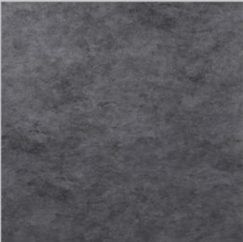
Code : 147