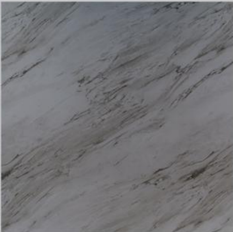
Code : 186