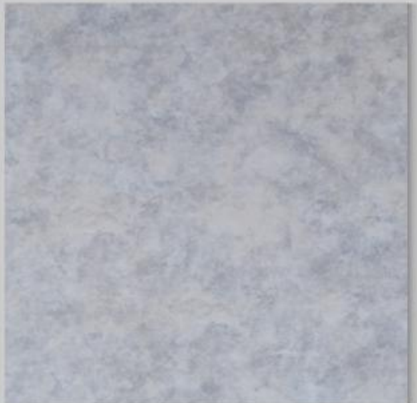
Code : 148