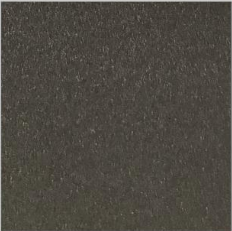
Code : 128