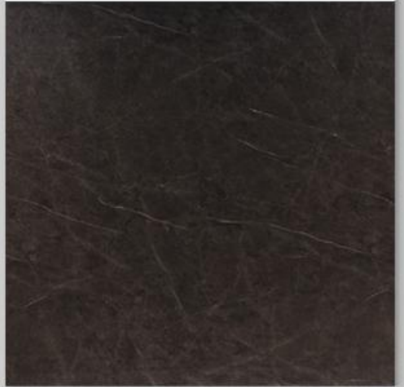
Code : 184